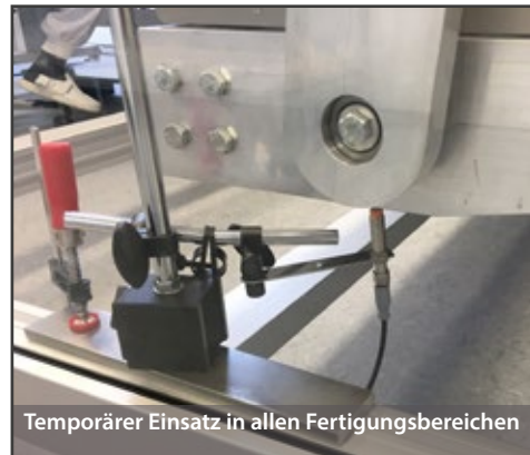
Temporärer Einsatz in allen Fertigungsbereichen